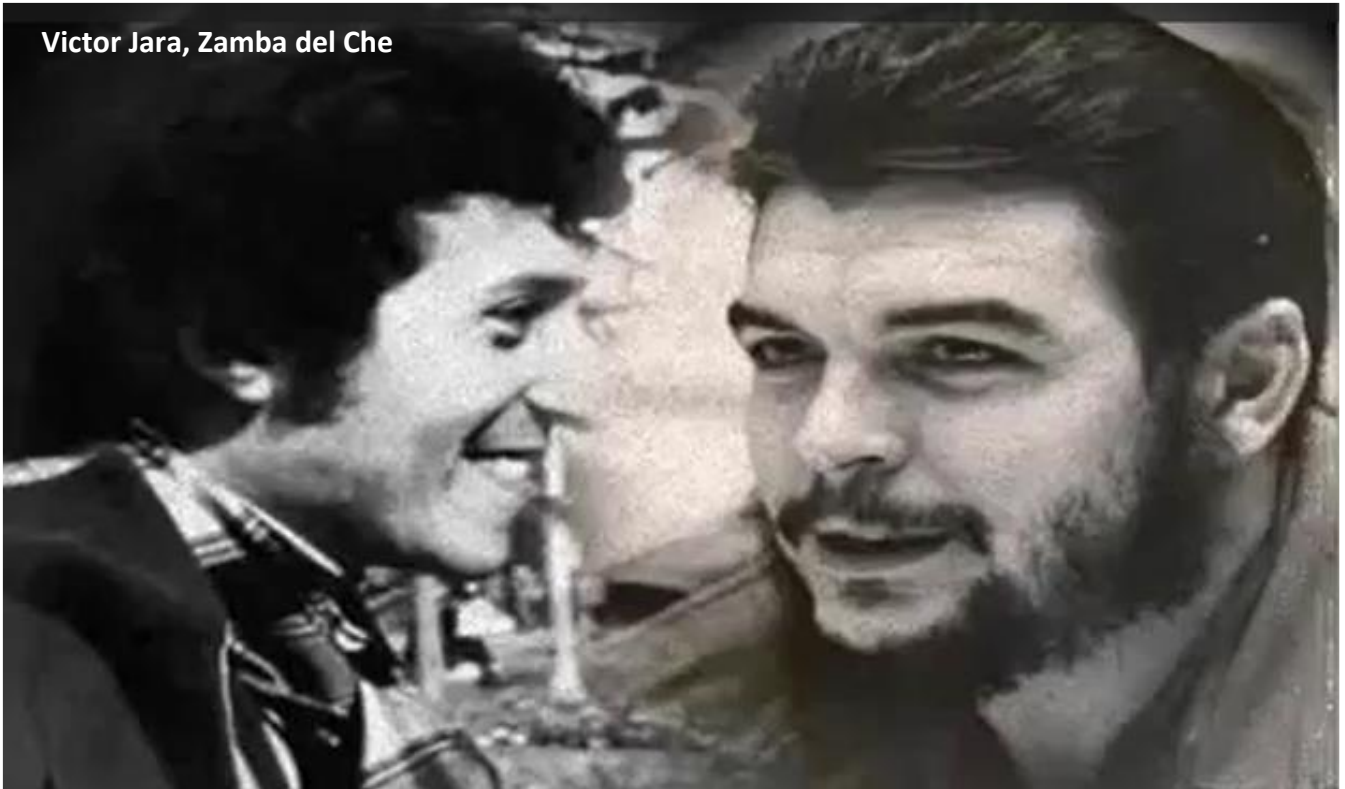
Victor Jara, Zamba del Che

«... τα ανθρώπινα δικαιώματα βιάζονται σε τόσα μέρη στη Λατινική Αμερική... Μας επιβάλλουν στρατιωτικούς να υποτάξουν τον λαό, δικτάτορες, δολοφόνους, γορίλες και στρατηγούς...» λέει ανάμεσα σε άλλα το τραγούδι Zamba del Che (1) , και μας θυμίζει τον πίνακα του Diego Rivera. Κοινή η ιστορία των χωρών της Λατινικής Αμερικής. Χώρες πλήρως εξαρτημένες από ξένα συμφέροντα, με κυβερνήτες υπάκουες μαριονέτες στις επιθυμίες των ξένων αφεντικών, “Δημοκρατίες της μπανάνας”. Είναι οι χώρες που οι ΗΠΑ θεωρούν σαν “την πίσω αυλή τους”.