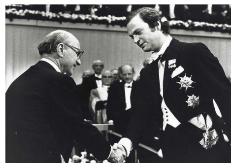
Ο Φρίντμαν τιμήθηκε με το βραβείο Νόμπελ Οικονομικών Επιστημών το 1976 για το «πρωτότυπο» όπως χαρακτηρίστηκε έργο του!

Και θα γράψει τότε ο Εντουάρντο Γκαλεάνο στο "Μέρες και νύχτες αγάπης και πολέμου": Οι θεωρίες του Μίλτον Φρίντμαν του έδωσαν το βραβείο Νόμπελ, στη Χιλή έδωσαν τον Πινοσέτ!