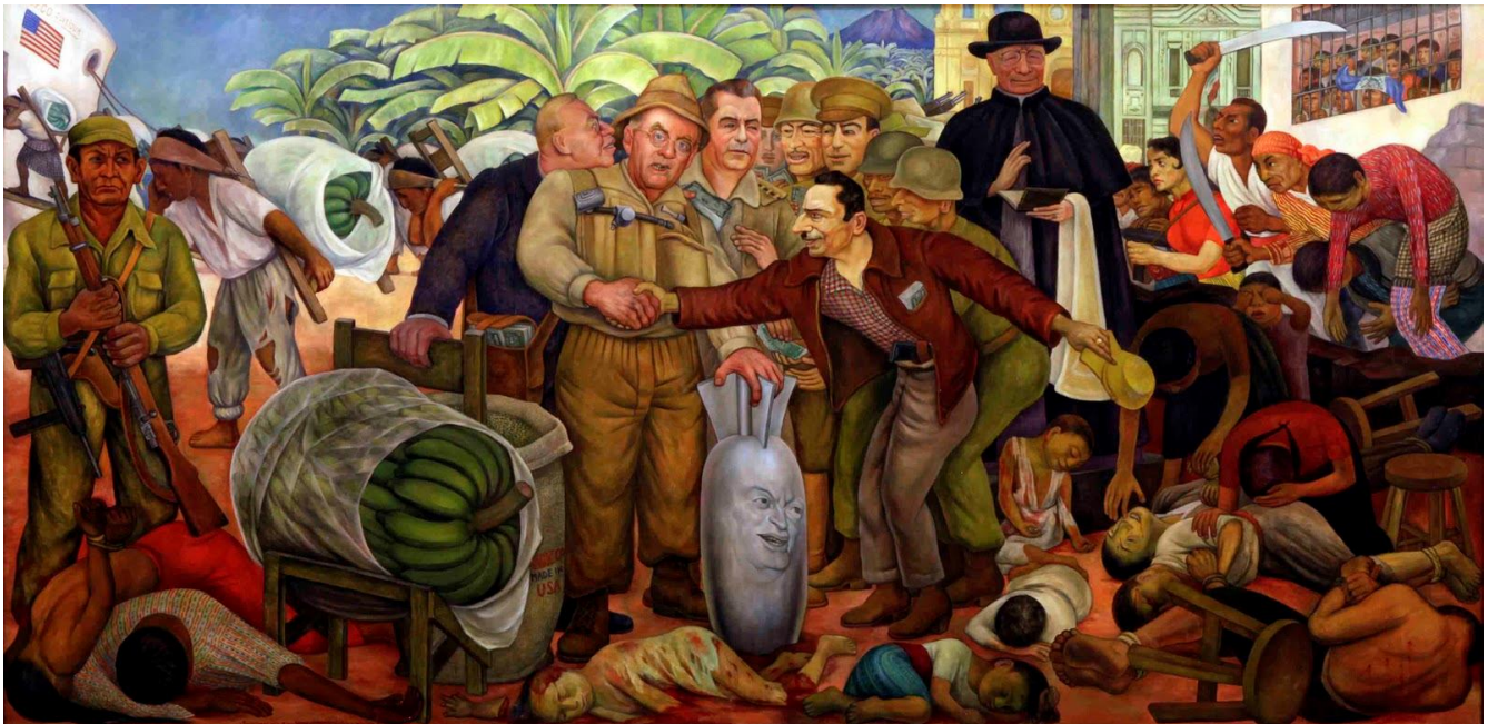
Ο διευθυντής της CIA John Foster Dulles δίνει τα χέρια με τον συνταγματάρχη Castillo Armas. Πίνακας του Diego Rivera, 1954.

«... τα ανθρώπινα δικαιώματα βιάζονται σε τόσα μέρη στη Λατινική Αμερική... Μας επιβάλλουν στρατιωτικούς να υποτάξουν τον λαό, δικτάτορες, δολοφόνους, γορίλες και στρατηγούς...» λέει ανάμεσα σε άλλα το τραγούδι Zamba del Che (1) , και μας θυμίζει τον πίνακα του Diego Rivera. Κοινή η ιστορία των χωρών της Λατινικής Αμερικής. Χώρες πλήρως εξαρτημένες από ξένα συμφέροντα, με κυβερνήτες υπάκουες μαριονέτες στις επιθυμίες των ξένων αφεντικών, “Δημοκρατίες της μπανάνας”. Είναι οι χώρες που οι ΗΠΑ θεωρούν σαν “την πίσω αυλή τους”.