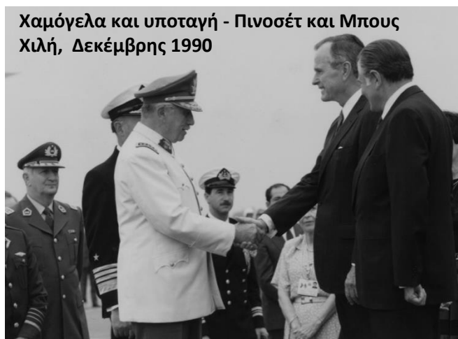
Χαμόγελα και υποταγή - Πινοσέτ και Μπους Χιλή, Δεκέμβρης 1990

Κίσινγκερ: «Δεν υπήρχε κανένας απολύτως λόγος να επιτραπεί σε μια χώρα να γίνει μαρξιστική μόνο και μόνο επειδή ο λαός της ήταν ανεύθυνος».