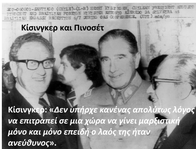
Κίσινγκερ και Πινοσέτ

Έτσι άρχισε η πολύχρονη υπαγωγή της Χιλής σε ένα από τα στυγνότερα φασιστικά καθεστώτα που επέβαλαν μέσα στον 20ό αιώνα το κεφάλαιο και οι πολυεθνικές για τη διατήρηση της εξουσίας τους, με τοποτηρητή των ΗΠΑ ένα κτηνώδες ανδρείκελο, τον Πινοσέτ, την "κυβέρνηση" του οποίου οι ΗΠΑ έσπευσαν πρώτα από όλα τα κράτη να αναγνωρίσουν.