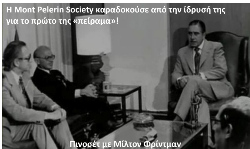
Η Mont Pelerin Society καραδοκώσε από την ίδρυσή της για το πρώτο της «πείραμα»!

Εκτός από τη φασιστική τρομοκρατία για να "να συνετίσει τους απείθαρχους" - ηλεκτροσόκ, βιασμοί, βασανιστήρια, εξαφανίσεις, εκτελέσεις και "ελεύθερες πτώσεις" στον Ειρηνικό Ωκεανό, η Χούντα «εισήγαγε» και οικονομολόγους από το Πανεπιστήμιο του Σικάγο, τον Μίλτον Φρίντμαν, εκ των ιδρυτών της Mont Pelerin Society, και "μαθητές" του - τα Chicago Boys, για να εφαρμόσουν, με την υποστήριξη των ΗΠΑ, τις νεοφιλελεύθερες πολιτικές τους. Και η χώρα μετατράπηκε σε ένα πεδίο μελέτης της εφαρμογής των «συνταγών» του Φρίντμαν, και σε ένα πειραματόζωο των «φαρμάκων» του ΔΝΤ.